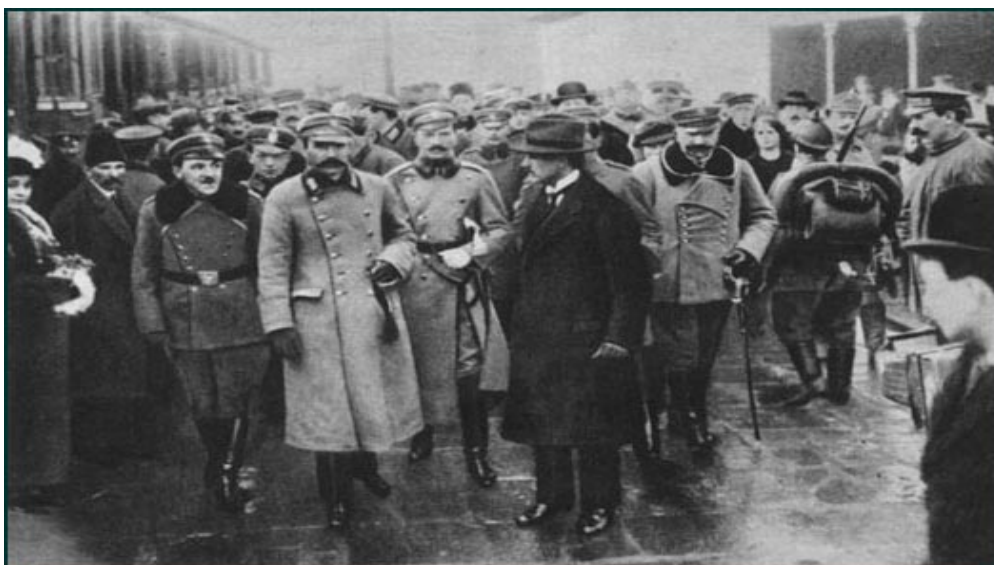
Powitanie Komendanta na dworcu kolejowym w Warszawie 11 listopada 1918 r.